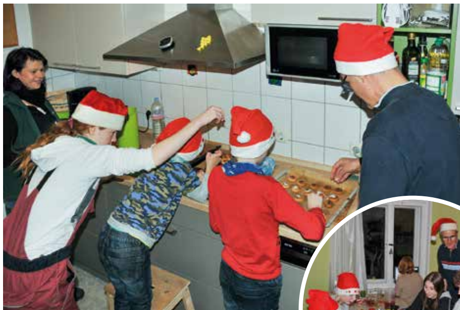
Weihnachtliches Plätzchenbacken oder Spielnachmittage sind nur einige der vielfältigen Angebote für die Kinder und Jugendlichen.