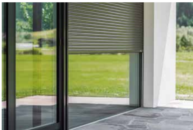
Hält neugierige Blicke ab und schiebt Einbruchversuchen wortwörtlich einen Riegel vor: ein moderner Rollladen mit innovativer Sicherheitstechnik.

Moderne Rollläden verbessern den Einbruchschutz von Fenstern