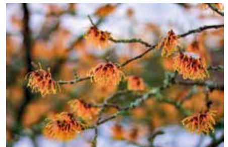
Bauen/Wohnen/Einrichten Schöner Garten im Winter