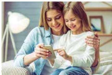
Tipps Familienfrieden per App