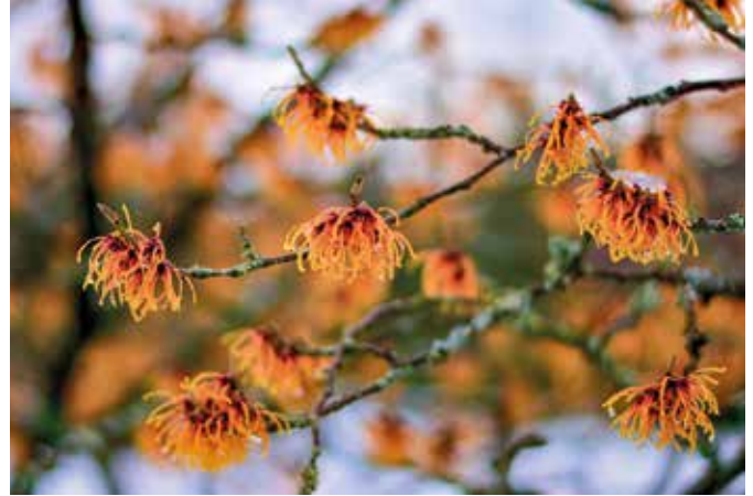
Klein, aber fein ist die Auswahl der Winterblüher – wie beispielsweise die Zaubernuss.

Gute Planung ist alles – das gilt auch für den eigenen Garten, an dem Nutzer ganzjährig ihre Freude haben wollen. Selbst im Winter bezaubert ein Garten mit eigenem Charme, wenn er richtig angelegt und mit passenden Hölzern und Sträuchern bestückt ist.